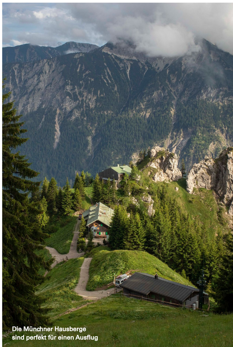
Die Münchner Hausberge sind perfekt für einen Ausflug