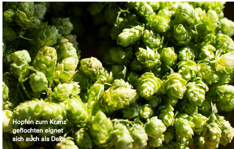
Hopfen zum Kranz geflochten eignet sich auch als Deko