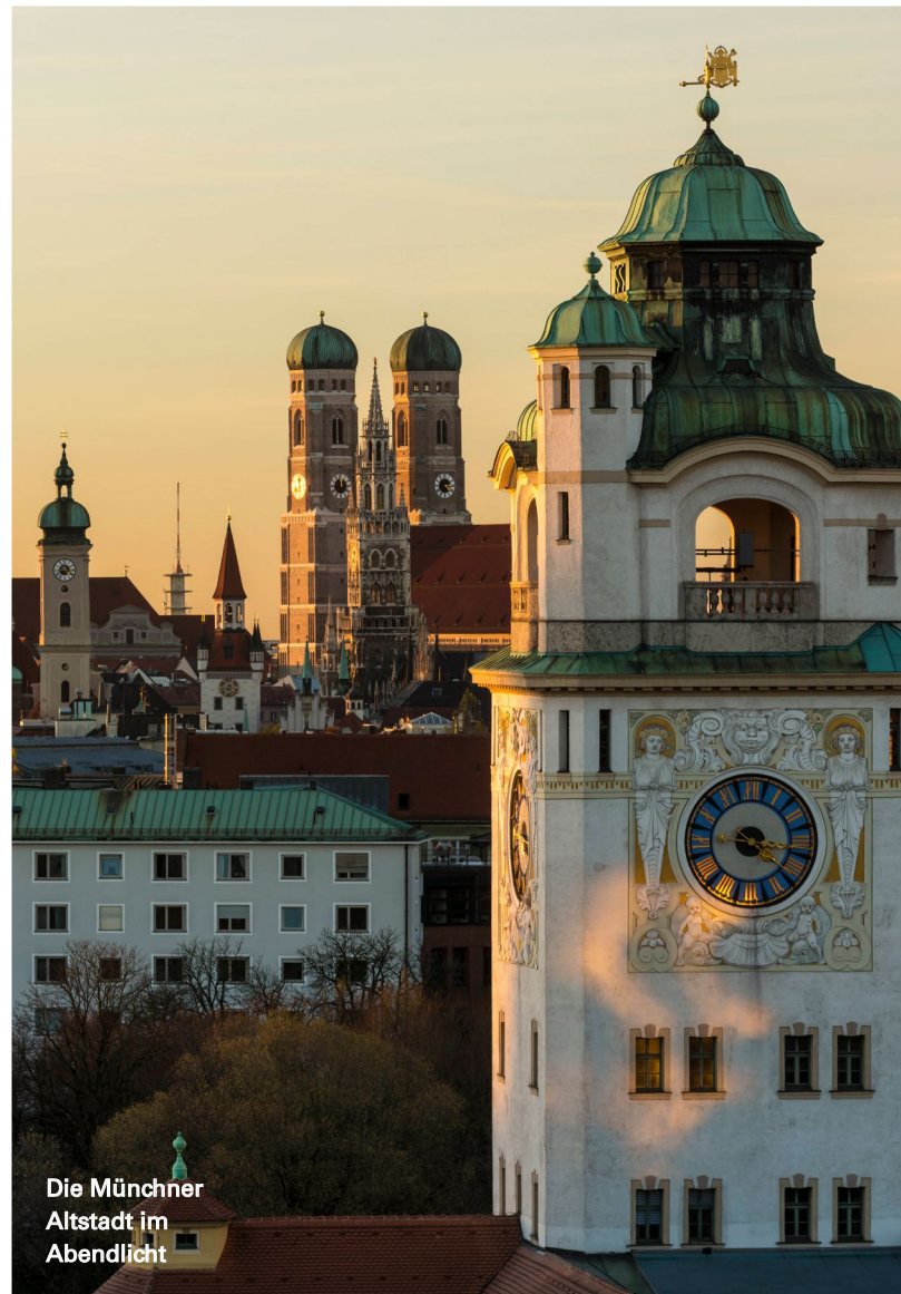
Die Münchner Altstadt im Abendlicht