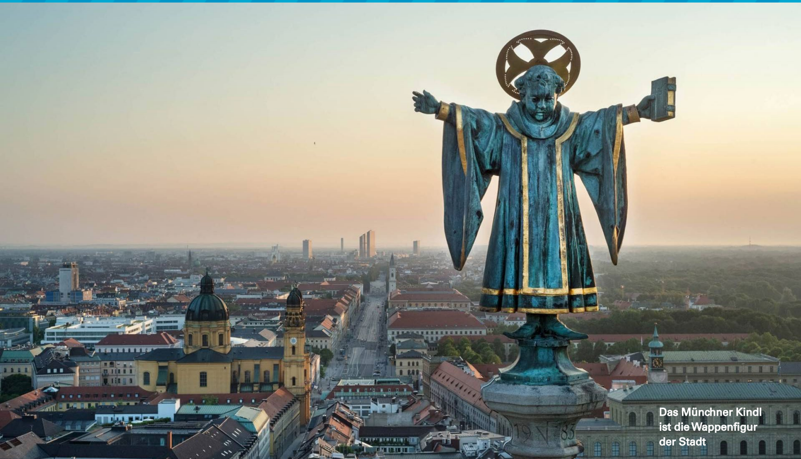
Das Münchener Kindl ist die Wappenfigur der Stadt